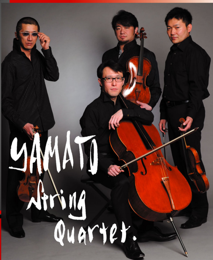
ゲスト：YAMATO String Quartet

■日 時：2016年7月23日(土) 18:30 開演(18:00開場) ■会 場：王子ホール(銀座) ■入場料：3,500円(全席自由)